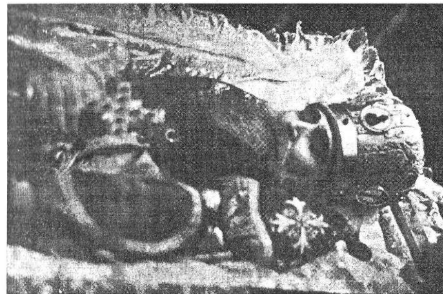
Патријарх Варнава на самртном одру (1937)

Док се у Народној скупштини водила општра дебата о Конкордату, живот Патријарха Варнаве се полако гасио. Конкордат је изгласан већином гласова (од 293 посланика за Конкордат је гласало 172).