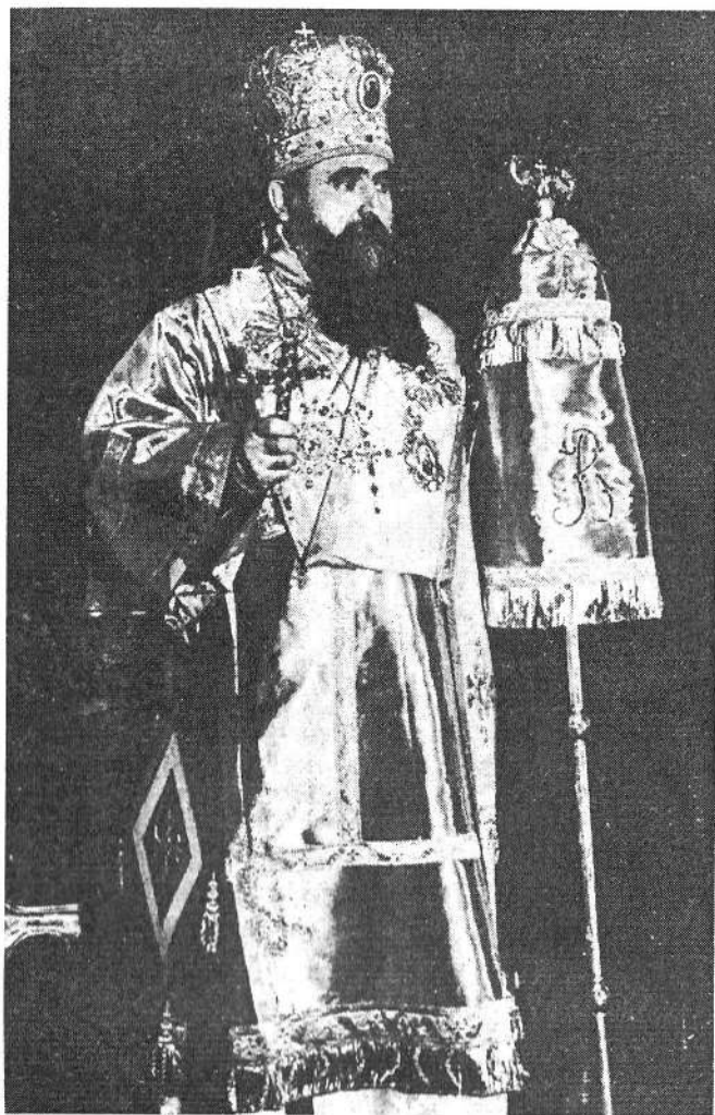
Патријарх Варнава (1930)

У име Свемогућег Бога и Господа нашег Исуса Христа, ја са овога места као други Патријарх српске православне цркве после њеног обновења подижем Патријаршијске руке и призивам помоћ Божију, да благослови нашег дичног Владара Краља Александра Првог и све нас. 37